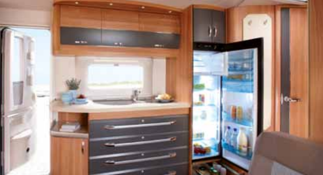
Küche mit Slim Tower Kühlschrank