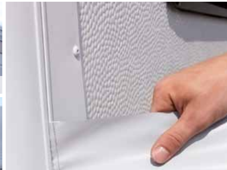
Kantenleistenverkleidung mit integrierter Vorzeltleiste