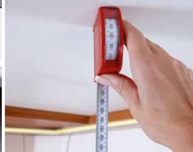
Innenstehhöhe von 1,95 Metern