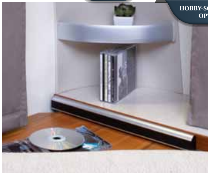
Extra schmale Design-Lautsprecher