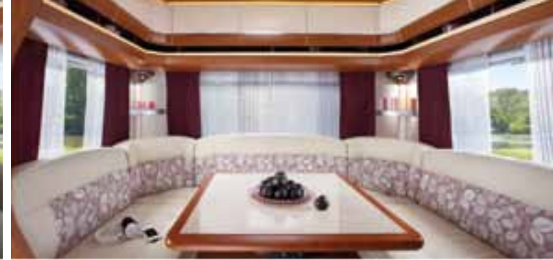
Madeira – Excellent