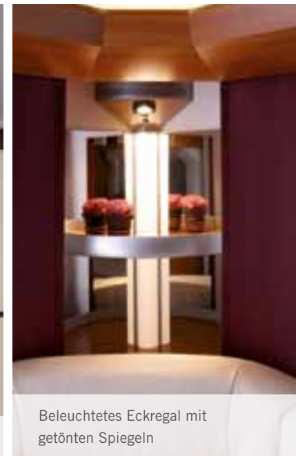
Beleuchtetes Eckregal mit getönten Spiegeln