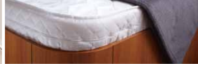
Betten mit Federkernmatratze