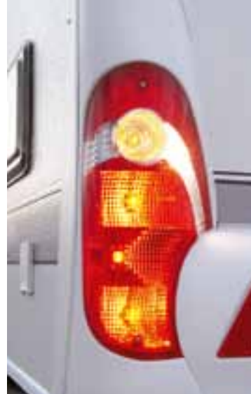
Heckleuchte mit integrierter Nebelschlussleuchte

Neben den Umrissleuchten sorgen die großen Heckleuchten und die dritte Bremsleuchte für zusätzliche Sichtbarkeit im Straßenverkehr. Der geräumige Gasflaschenkasten hält den Gasvorrat unverrückbar an Ort und Stelle und bietet außerdem Platz für den rollbaren Abwassertank und ein optionales Reserverad.