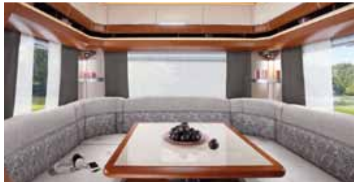
Cannes – Premium