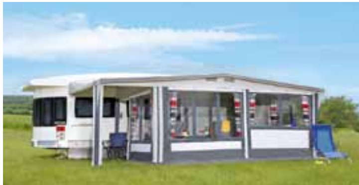
LANDHAUS: Exklusiv, luxuriös und sehr individuell