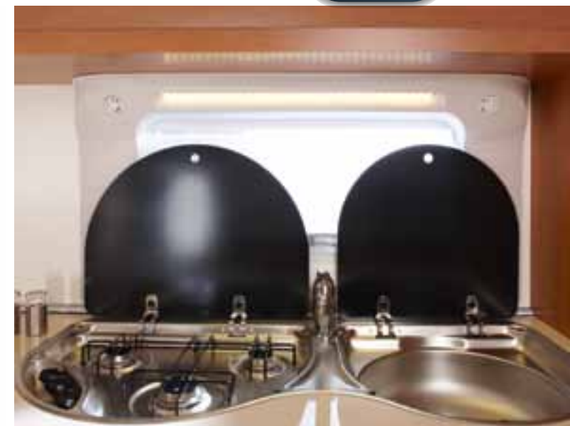
Edelstahl-Kombination mit 3-Flammen-Kocher und Spüle