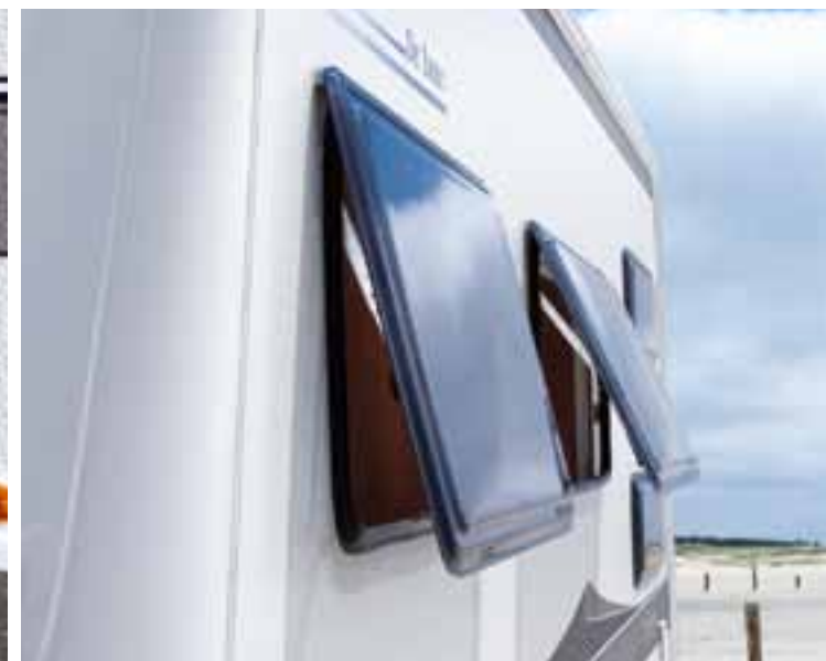
Gute Isolierung durch doppelverglaste, ausstellbare Fenster