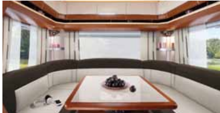
Laos – Prestige