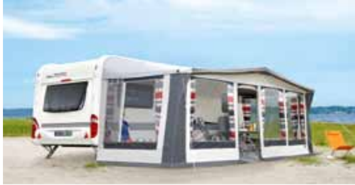
TRAVEL: Das schicke Reisezelt mit Panoramablick