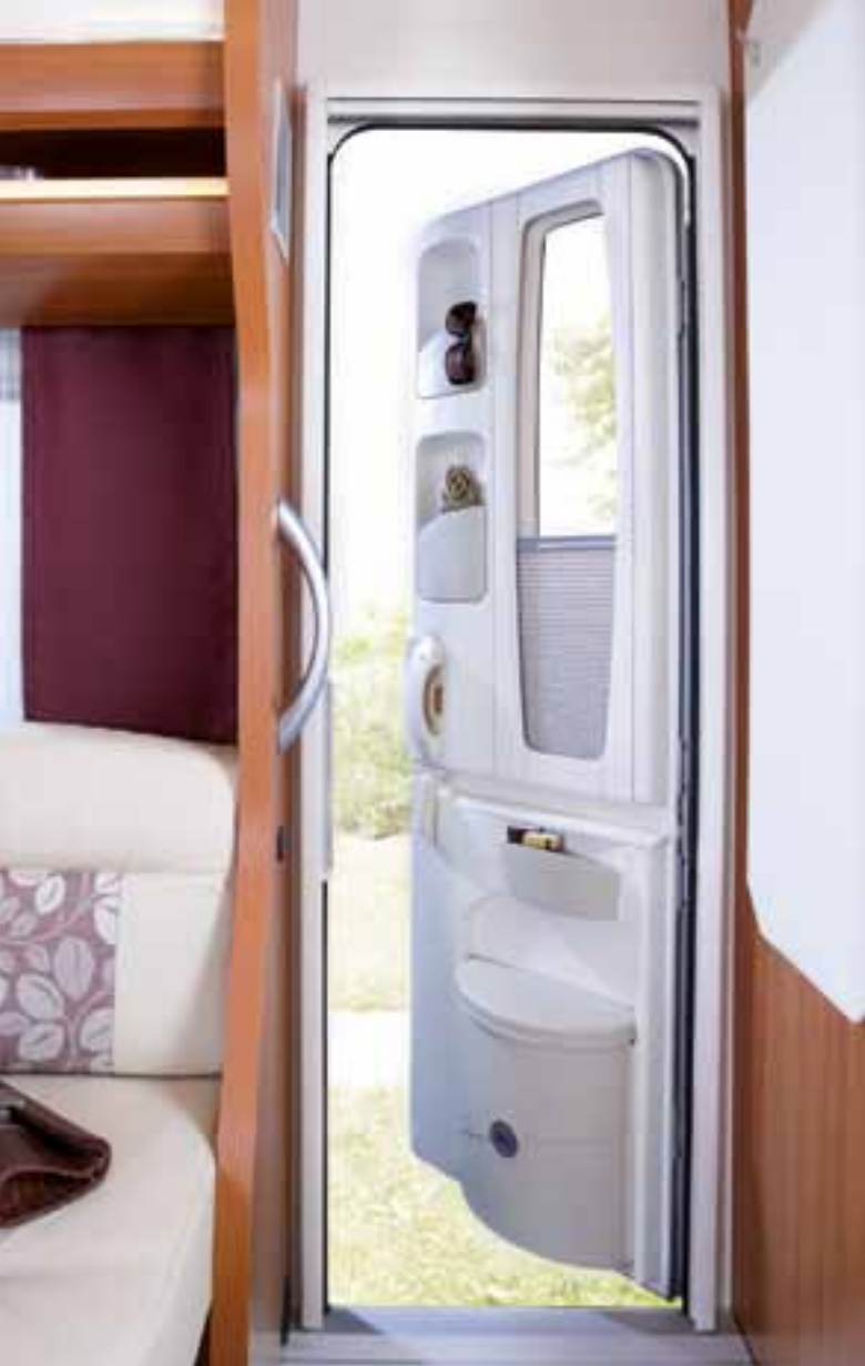
Zweiteilige Eingangstür mit Abfalleimer und Insektenschutzplissee im Türrahmen