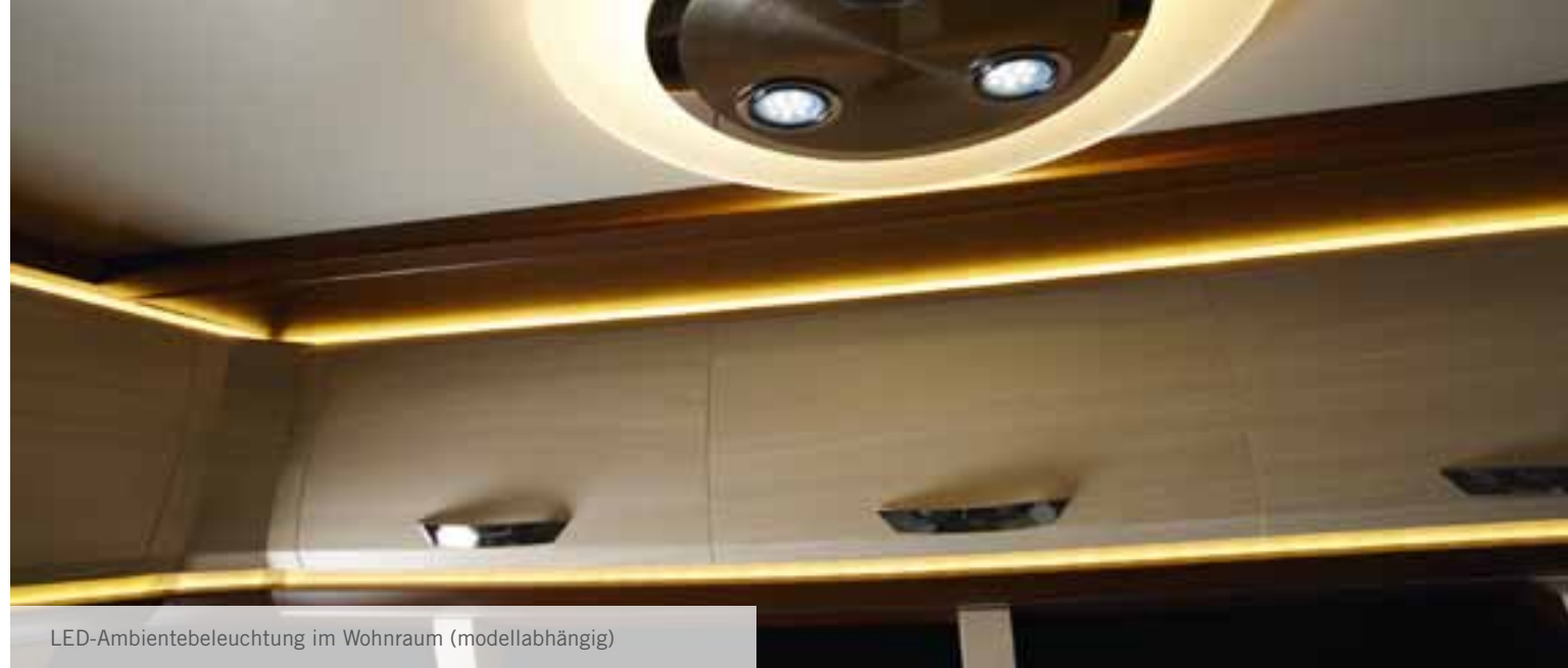
LED-Ambientebeleuchtung im Wohnraum (modellabhängig)

Am Abend schützen Insektenschutzplissees an den Dachhauben und Fenstern im Wohn-, Schlaf-, und Küchenbereich vor unerwünschtem Insekten-Besuch. Zusätzliche Verdunkelungs- und Insektenschutzplissee sind die beste Voraussetzung für einen langen und ungestörten Schlaf.