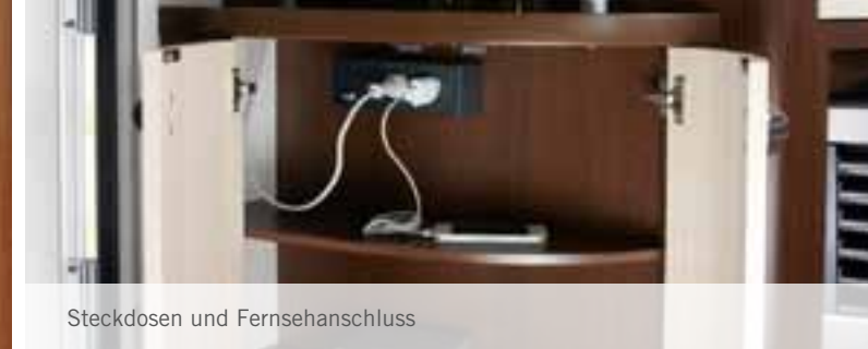
Steckdosen und Fernsehanschluss