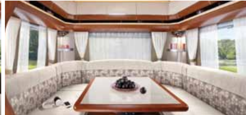
Devon – Landhaus