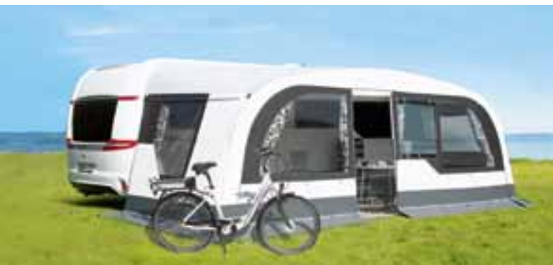
PREMIUM LIGHT: Elegante Form im edlen Premium-Look