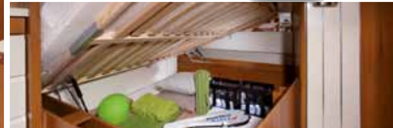
Pneumatischer Betaufsteller (modellabhängig)