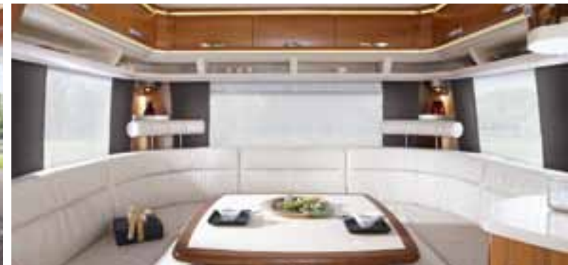
Leder cremeweiß (nur PREMIUM und LANDHAUS, Abb. PREMIUM)