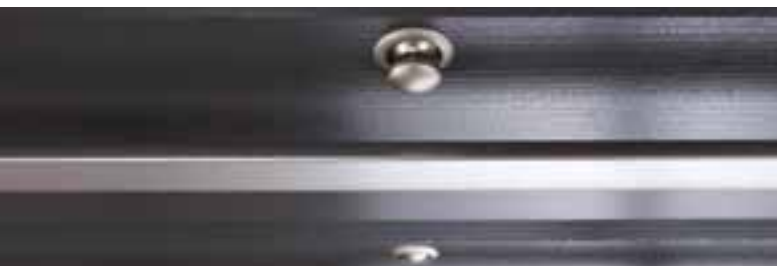
Extrabreite Schubladen mit PushLock