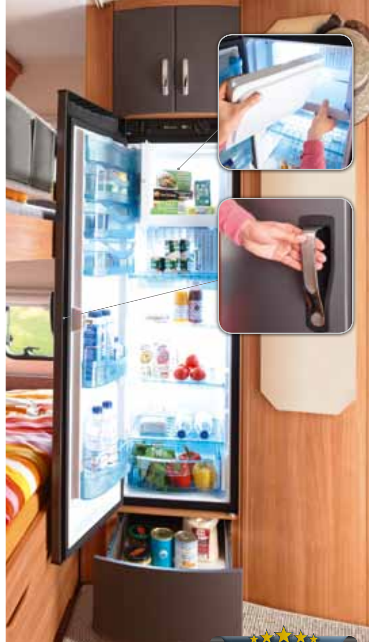
Kühlschrank Slim Tower, 140 Liter