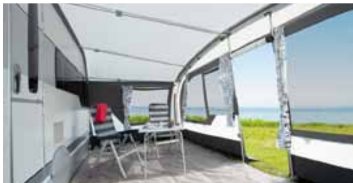
Innenraum PREMIUM LIGHT