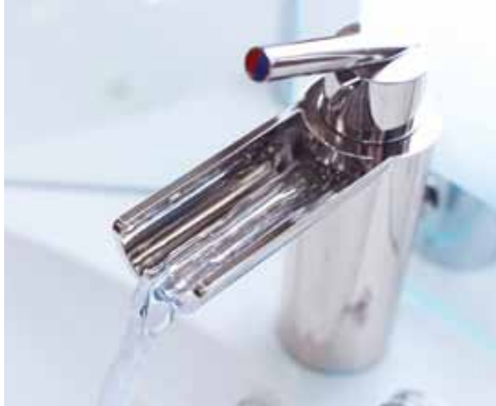
Kaskaden-Wasserhahn im Bad