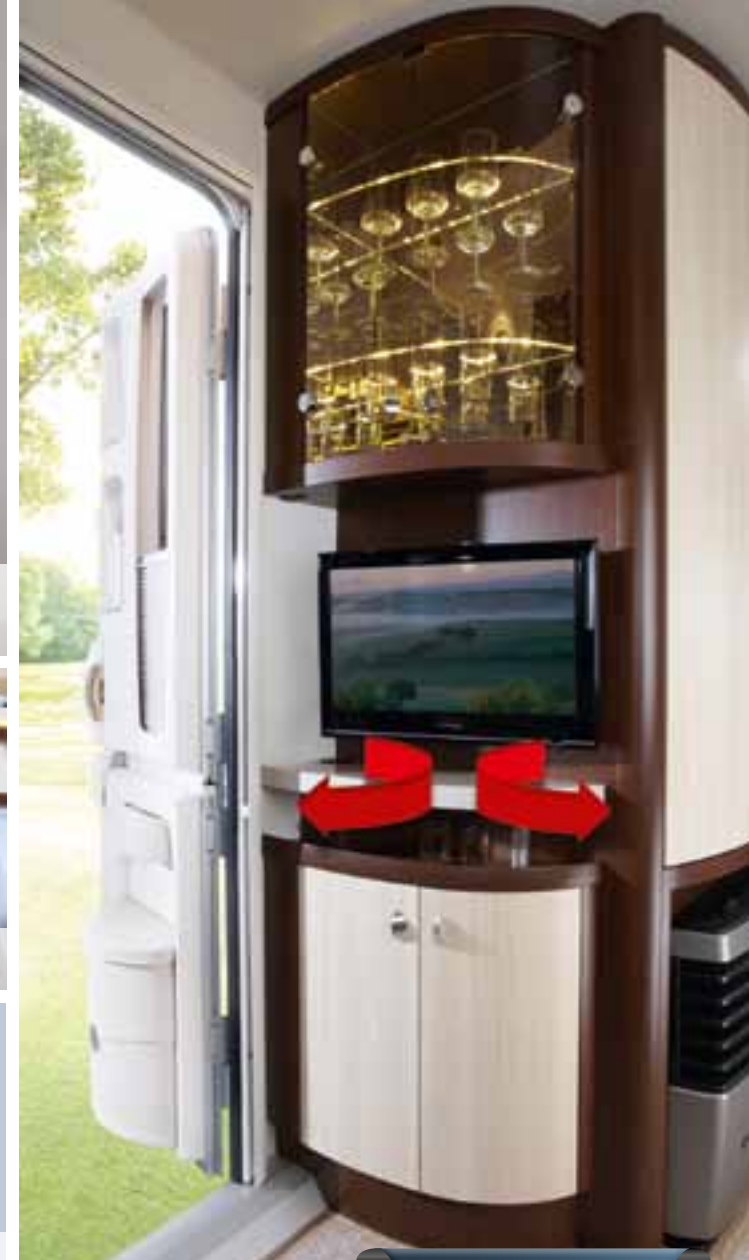
TV-Anrichte mit Glasvitrine