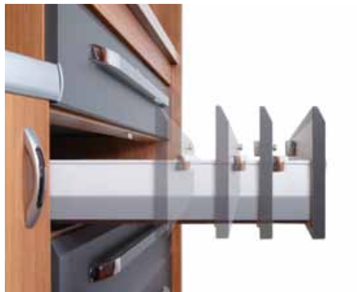
Schubladen mit Softeinzug