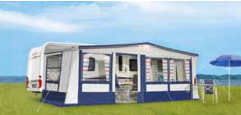
SEASON: Der vielseitige Partner für die ganze Saison