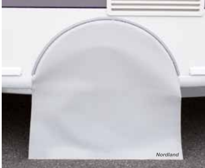
Radkastenblende mit integrierter Kederleiste