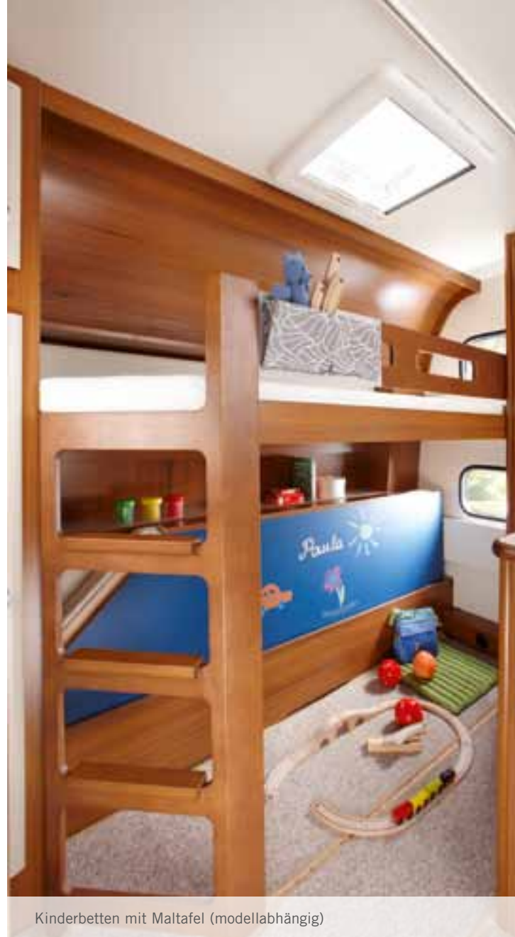
Kinderbetten mit Maltafel (modellabhängig)

Gleich mehrere piffige Ideen zeichnen die Kinderbetten aus. Stofftaschen bergen die Schätze der Kleinen, die zum Einschlafen auf keinen Fall fehlen dürfen, und halten Ordnung. Tagsüber kann das untere Bett hochgeklappt werden, darunter entsteht Raum zum Spielen – mit der Bettunterseite als abwischbare Maltafel. Kindgerecht ist auch die Bettleuchte mit Teddybär-Motiv. Dreht man an der Nase des Bärchens, wird das Licht gedimmt – und der Nachwuchs träumt sich ins Abenteuerland.