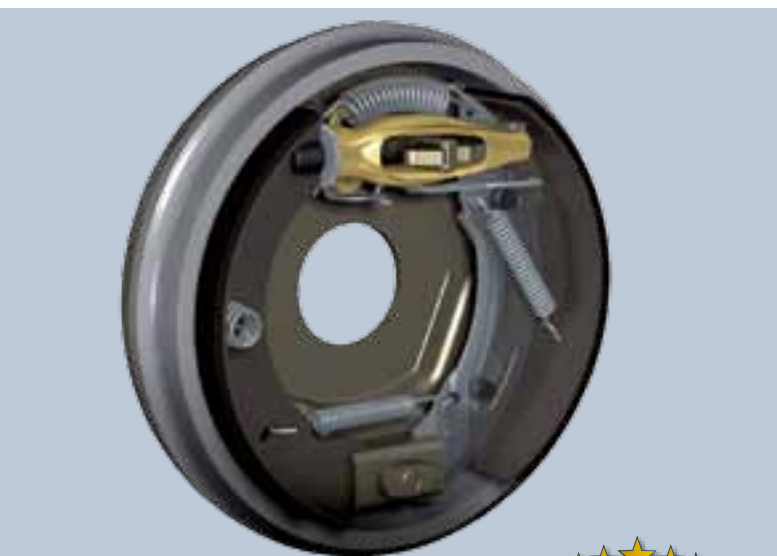
KNOTT-Bremsen mit automatischer Nachstellung (Baureihe Premium)