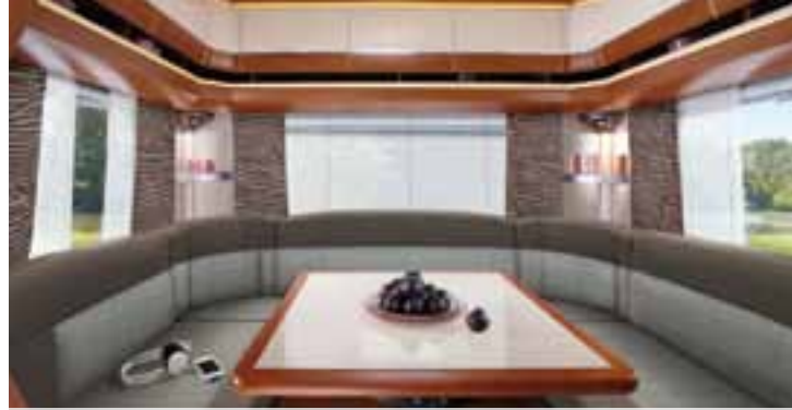
Cocoa – De Luxe

Noch mehr Sonderausstattungen finden Sie in unserer Preisliste oder auf www.hobby-caravan.de