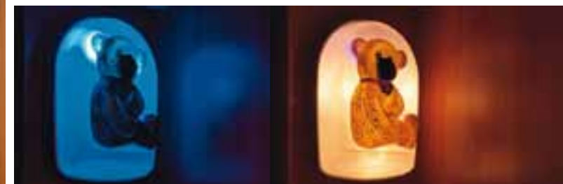
Kinder-Bettleuchte mit Teddybär-Motiv