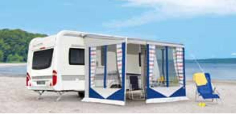
EASY: Markisenzelt, zum Vorzelt erweiterbar