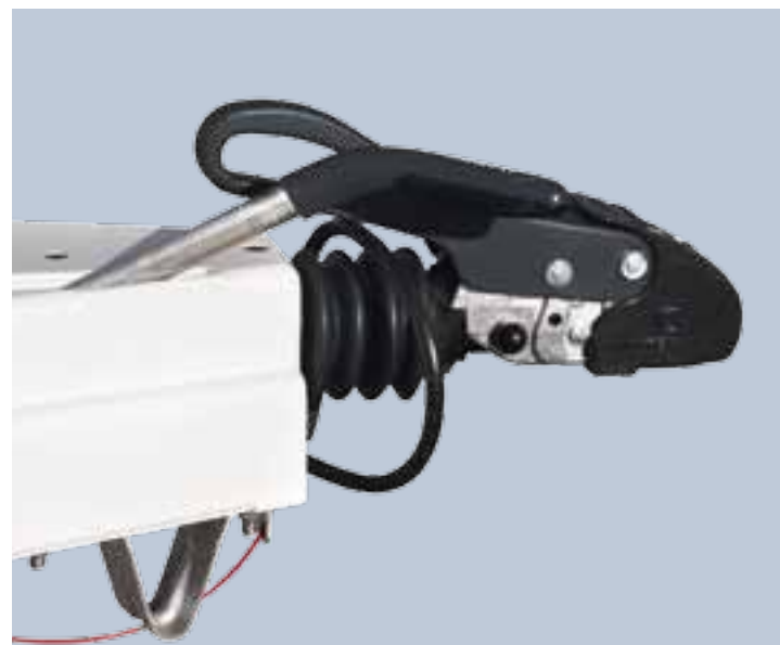
WINTERHOFF-Antischlinger-Kupplung mit Auflaufbremssystem