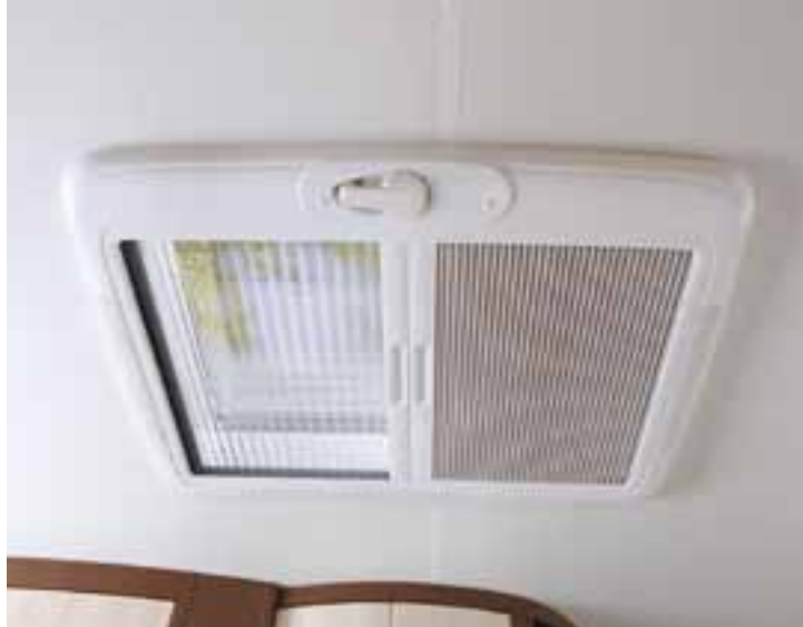
DOMETIC-SEITZ Heki-Dachhaube mit Verdunkelungs- und Insektenschutzplissee