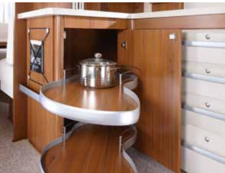
Eck-Unterschrank (nur in Winkelküche)