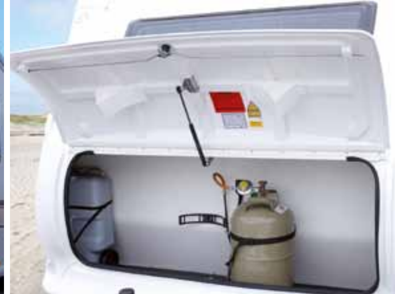
Besonders geräumiger Gasflaschenkasten