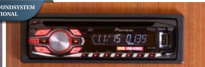
Radio von PIONEER