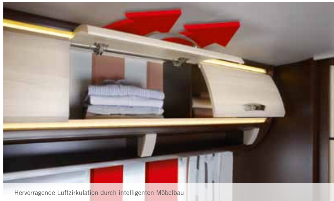
Hervorragende Luftzirkulation durch intelligenten Möbelbau