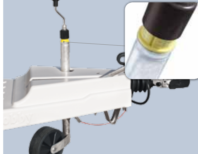
Zugdeichsel mit Abdeckung und Stützlastwaage