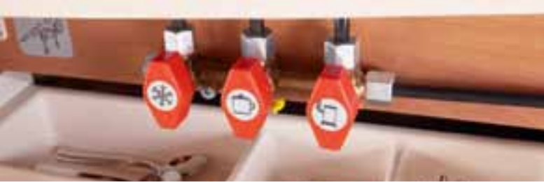
Zentraler Gasverteiler in der Küche