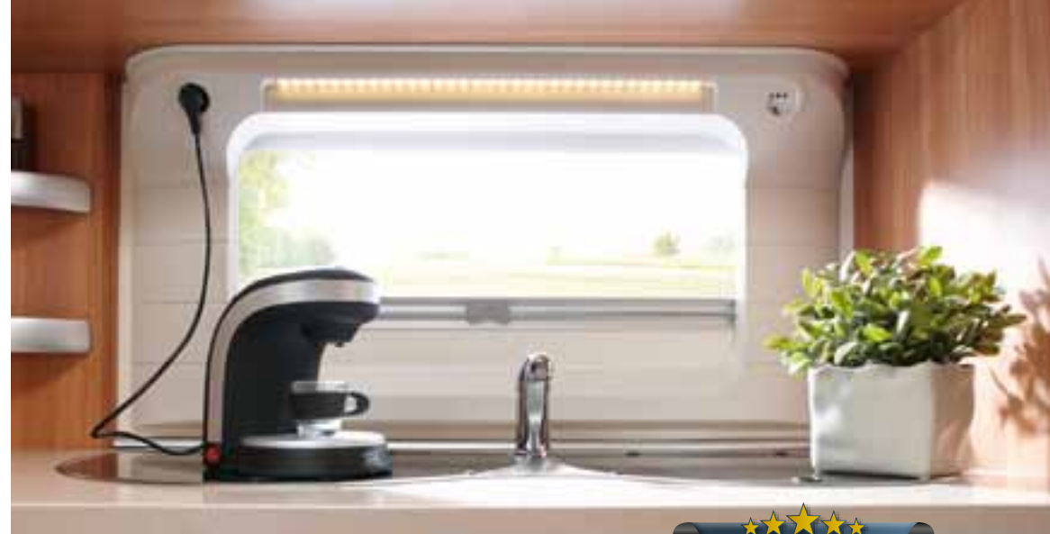
Küchenrollo mit integrierten Steckdosen und LED-Küchenleuchte